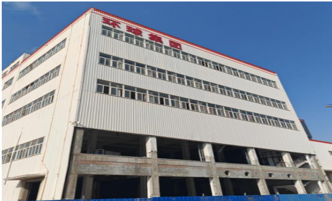
图 3 事故建筑外观