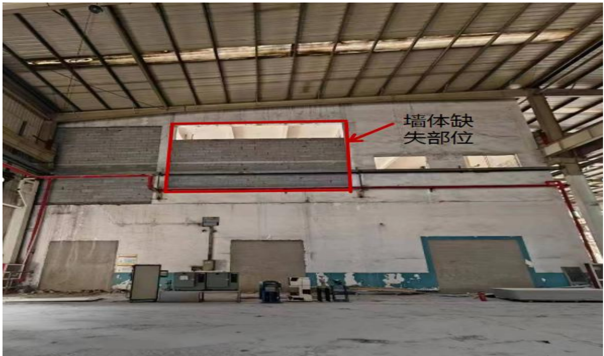
图 7 事故建筑墙体缺失情况（北侧贴邻仓库一层拍摄）