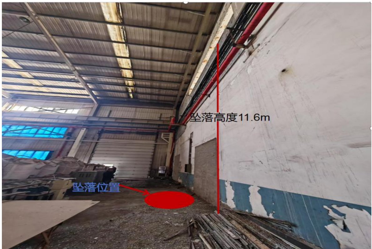
图 9 人员坠落位置