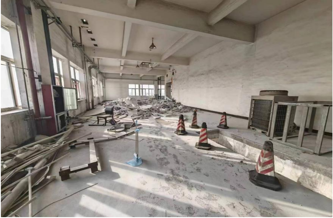
图 4 事故建筑内部情况