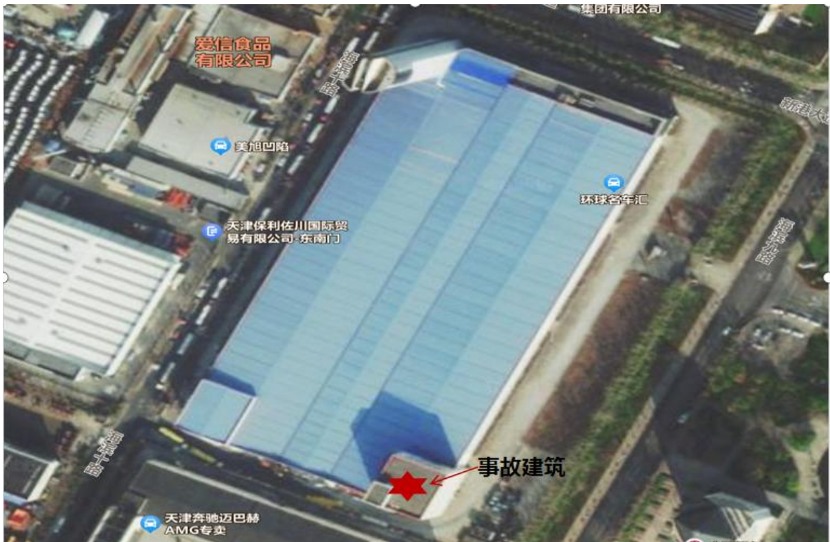
图1 事故建筑位置示意图

事故建筑位于环球路港公司东南角,耐火等级二级,主体结构为钢筋混凝土框架结构,建筑面积3500 m 2 ,层数五层,建筑高度24m。使用性质为综合楼,目前为闲置状态,正在进行内部装修。北侧、西侧贴邻仓库,南侧为院墙,东侧使蓝色钢板进行围挡。