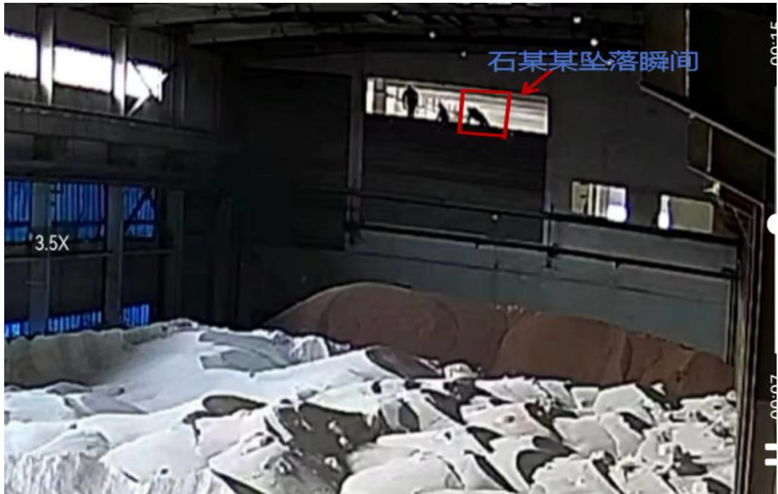
图 10 事故发生时视频监控截图