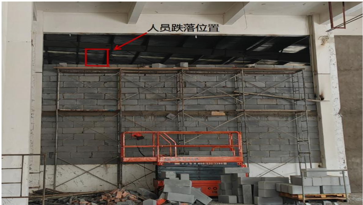
图 8 人员跌落位置