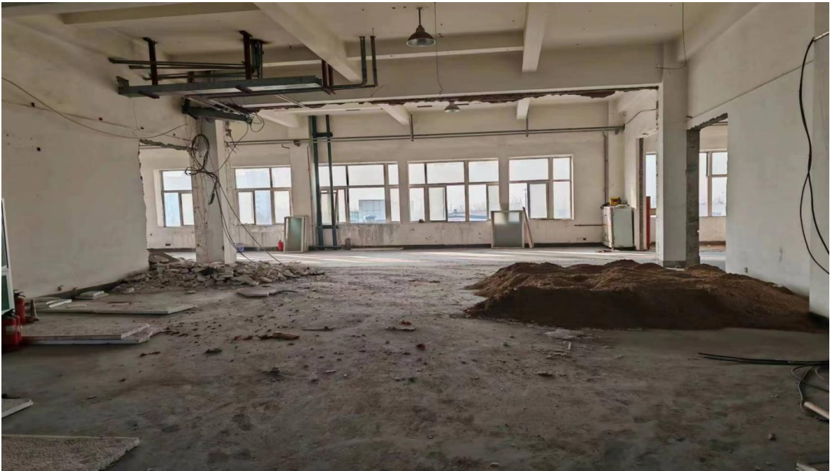
图 5 事故建筑内部情况