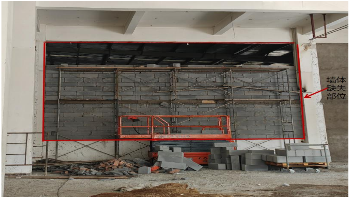
图 6 事故建筑墙体缺失情况（事故建筑二层拍摄）